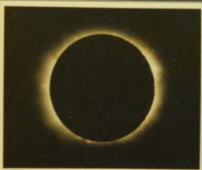
1906 - 1907 - Vancouver, BC, 1906