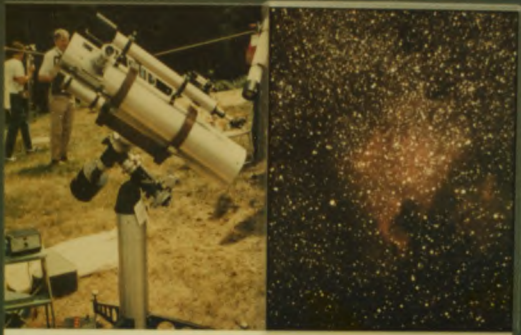
18 CENTRE FRANCAIS DE MONTREAL Founded 1947, 88 members in 1978 Fondee en 1947, 88 membres en 1978

21 ST. JOHN'S Founded 1966, 12 members in 1978 Fondee en 1966, 12 membres en 1978