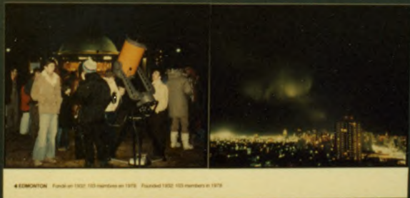
4 EDMONTON Pinned in 1902, 103 members in 1976. Pinned 1902, 103 members in 1976