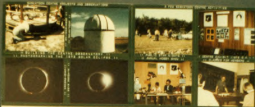
5 EDMONTON Founded 1847, 100 members in 1888, 34 members in 1976. Pinned in 1901, 100 members in 1988, 34 members in 1976