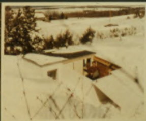
19 QUEBEC - Founded 1962, 117 members in 1975 - Fondee en 1962, 117 membres en 1975