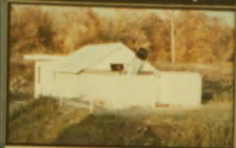
Founded 1908 as the Ottawa Section of the R.A.S.C., becoming the Ottawa - Fondee en 1908 sous le nom de Section d'Ottawa de la S.R.A.C., Centre in 1968, 210 members in 1975. - Devenu le Centre d'Ottawa de la S.R.A.C. en 1968, 210 membres en 1975.