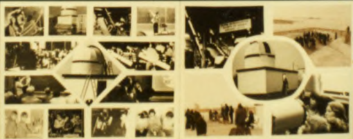
7 WINNIPEG Pinned in 1901, 72 members in 1976. Pinned in 1901, 72 members in 1976