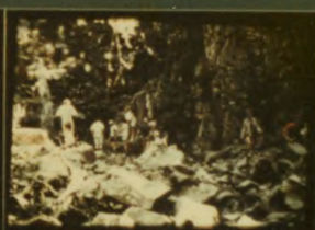
20 HALIFAX - Founded 1955, re-established 1975, 100 members in 1975 - Fondee en 1955, rétablie en 1975, 100 membres en 1975