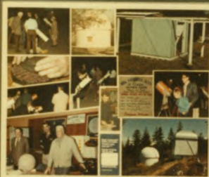
2 VANCOUVER Founded 1801, 134 members in 1876. Pinned in 1901, 134 members in 1976