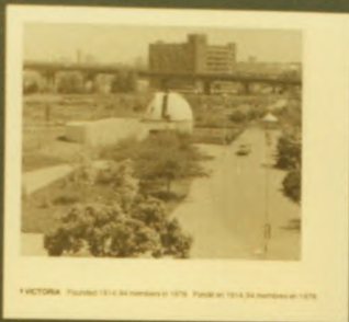
1 VICTORIA Founded 1814, 34 members in 1876. Pinned in 1914, 34 members in 1976