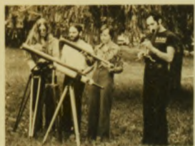
18 KINGSTON - Founded 1961, 21 members in 1975 - Fondee en 1961, 21 membres en 1975