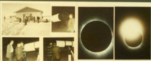
6 CALGARY Founded 1857, 100 members in 1888, 34 members in 1976. Pinned in 1901, 100 in 1988, 34 members in 1976