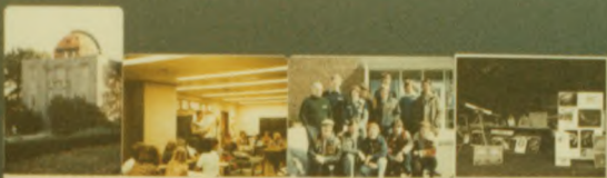
17 LONDON - Founded in 1922, 80 members in 1975 - Founded 1922, 40 members in 1975